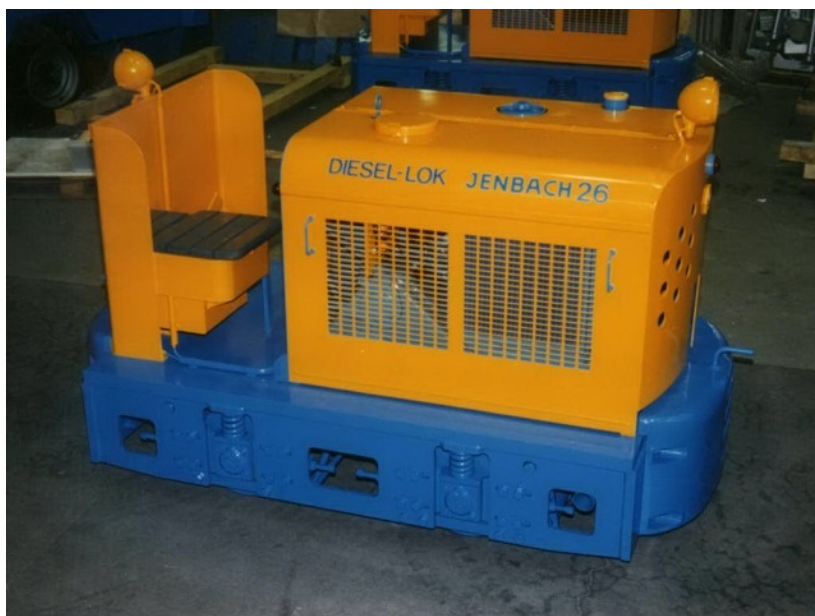
Grubenlok Spurweite 7 ¼ Zoll