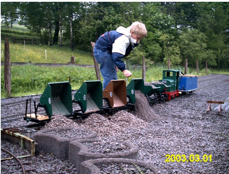
Feldbahn Spielzug Spurweite 5 Zoll