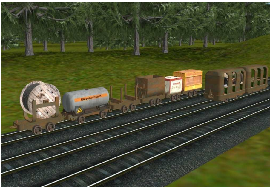
Verschiedene geplante Loren Spurweite 7 ¼ Zoll