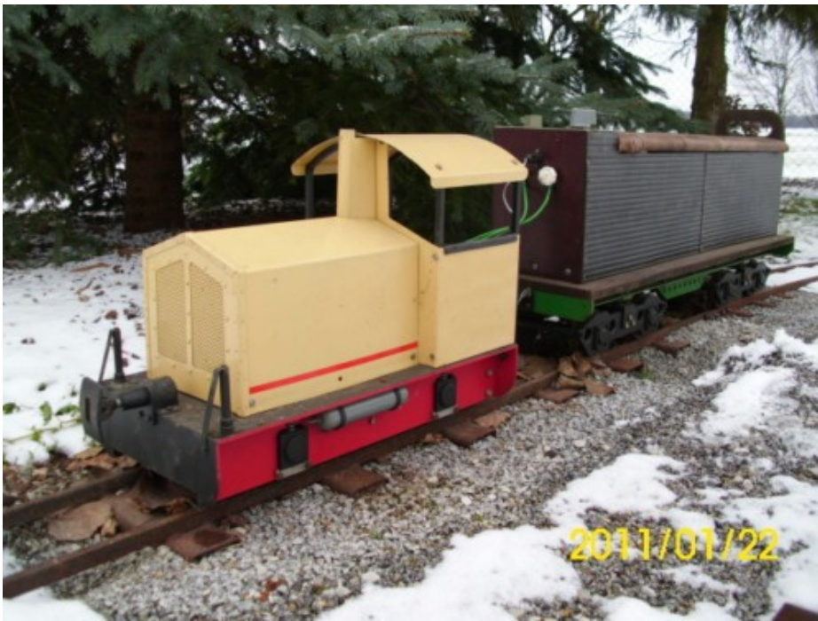
Grubenlok und Mitfahrwagen Spurweite 5 Zoll