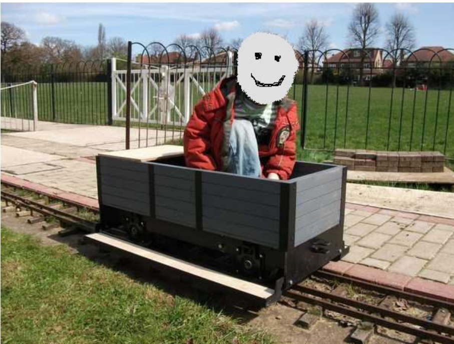
Kindermitfahrwagen Spurweite 7 ¼ Zoll